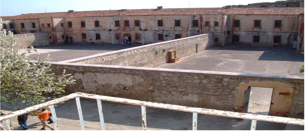
Resim-7: Tarihi Sinop Cezaevi

Katılımcılar özellikle cezaevinin bir an önce restore edilmesi gerektiği konusunda görüş bildirmişlerdir. Ayrıca yapılacak düzenlemelerle, o dönemin atmosferini ziyaretçilere yaşatacak, dönemin şartlarını hissettirecek bir ortamın yaratılmasına özen gösterilmesi gerektiğini belirtmişlerdir.