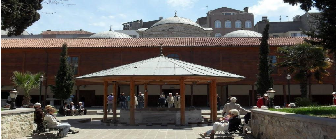
Resim-6: Alaaddin Camii

Bu önemli eserlerin korunmasına özel önem gösterilmesi gerektiğini kaydeden katılımcılar, özellikle çevre düzenlemesi ve bu alanlarda faaliyet gösteren işletmeler konusunda daha hassas olunması gerektiğini kaydetmişlerdir