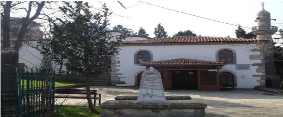
Resim-2: Seyid Bilal Hazretleri Türbesi

Sinop'un en önemli manevi hazinelerinden biri olan Seyid Bilal Hazretleri Türbesi, pek çok turist için de vazgeçilmez bir duraktır. Yalnız denizi ve doğası ile değil, sahip olduğu tarihi ve manevi değerleri ile de ön plana çıkma potansiyeli yüksek olan Sinop'u her yönüyle tanıtabilmek için ziyaret edilmesi gereken türbe, katılımcıları oldukça etkilemiştir.