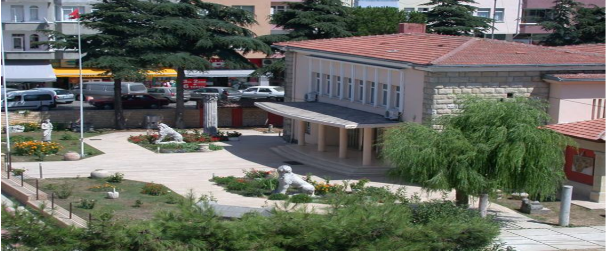
Resim-3: Sinop Arkeoloji Müzesi

Katılımcılar, müzelerin oldukça zengin olduğunu ancak özellikle eserlerin altındaki açıklayıcı bilgilerin daha detaylı bir şekilde sunulmasının ziyaretçi memnuniyeti ve eserlerin etkin tanıtımı açısından önemini belirtmişlerdi.