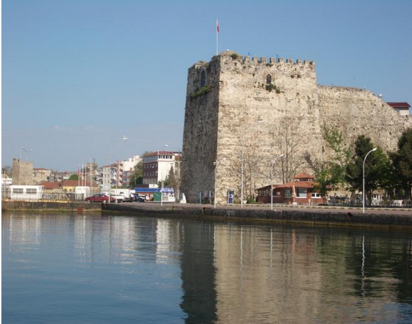
Resim-8: Sinop Kalesi Burcu

Sinop Kalesi ve kalıntılarının çok önemli bir tarihi miras olduğunu vurgulayan katılımcılar, özellikle kale çevresindeki çarpık yapılaşmanın ve gecekondu tipi yapıların kale için yarattığı tehlikeye dikkat çekmişler ve en kısa sürede bu yapıların temizlenmesi gerektiğini önemle belirtmişlerdir.