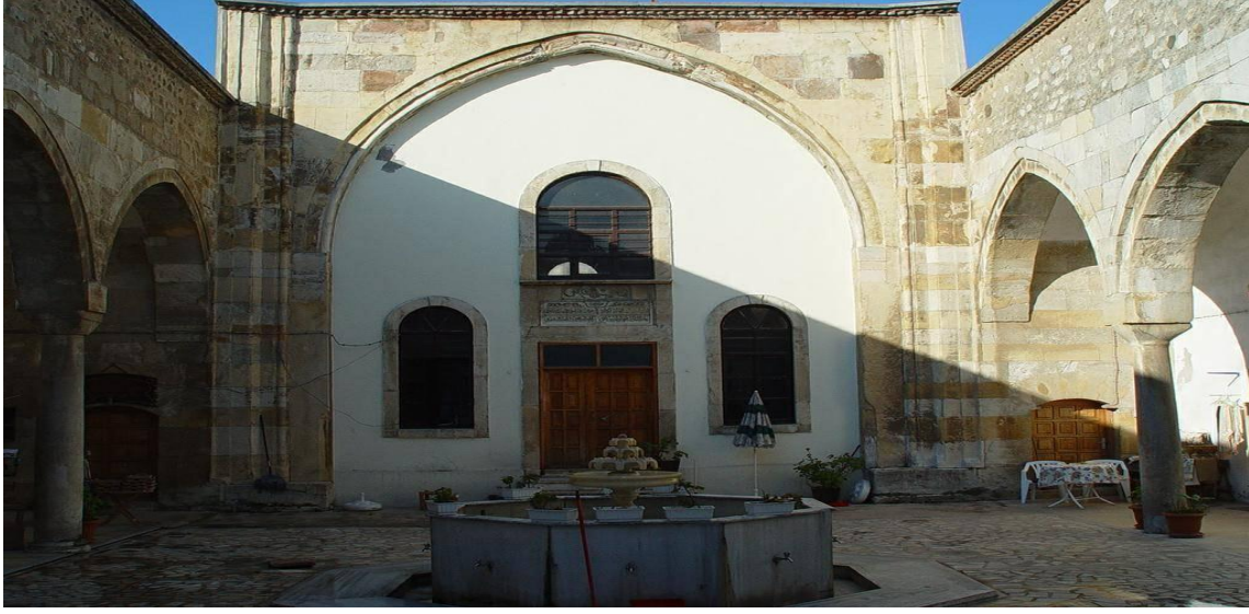
Resim-5: Pervane Medresesi

Bu önemli eserlerin korunmasına özel önem gösterilmesi gerektiğini kaydeden katılımcılar, özellikle çevre düzenlemesi ve bu alanlarda faaliyet gösteren işletmeler konusunda daha hassas olunması gerektiğini kaydetmişlerdir