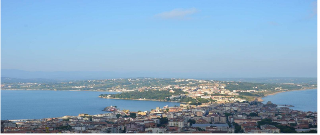
Resim-1: Seyir Tepesi Mevkiinden Sinop

24 Mayıs günü ilimize gelen turizm firmalarının temsilcileri, otellerine yerleştirmeden önce Sinop'un eşsiz güzellikteki manzarasını görebilmeleri için, şehrin "ada" diye tabir edilen bölgesinde bir tura çıkmıştır. Seyir Tepesi diye adlandırılan ve konumu itibari ile Sinop'u oldukça yüksekte görme imkanı veren bu bölgede katılımcılara, 4 gün süresince gezilecek yerler ve Sinop hakkında özet bilgiler verilmiştir.