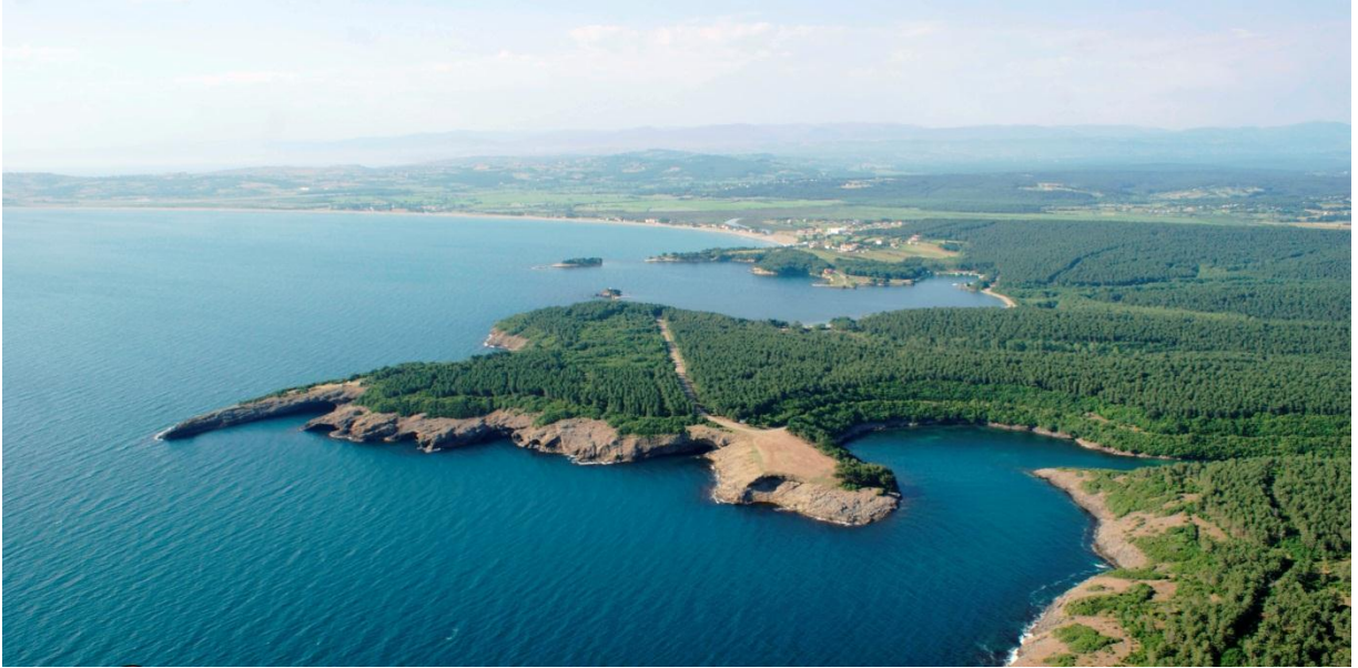
Resim-9: Akliman Bölgesi

Ayrıca bu bölgelerde ciddi anlamda çevre kirliliği de gözlemlenmiştir. Çöp konteynırı ve gerekli teçhizatın bölgeye yerleştirilmesi yerinde olacaktır. Ayrıca bölgeye giden turistlerin vakit geçirebilmesi için çay bahçelerinin, kafelerin ve benzeri kısa süreli konaklama imkanı sağlayan işletmelerin faaliyete geçmesi yine turist memnuniyetini artırma açısından faydalı olacaktır.