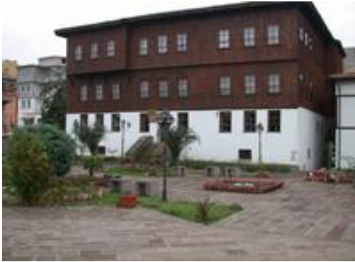
Resim-4: Sinop Etnografya Müzesi

Özellikle Sinop Etnografya Müzesi'nin ülkemizde bir eşinin daha olmadığını belirten katılımcılar, etkin tanıtım çalışmaları ile bu değerlerin daha geniş kitlelere ulaştırılması gerektiğini söylemişlerdir.