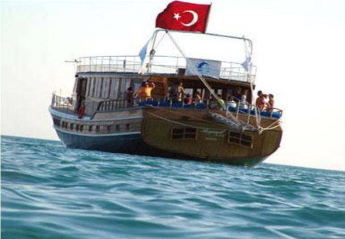
Resim-13: Tekne Turu

Çalıştay kapsamında katılımcılara son gün tekne turu yaptırılmıştır. Hem Sinop'u denizden görmek hem de güzel bir gün geçirmek için özellikle yaz aylarında tercih edilen bir turizm faaliyeti olan tekne turundan oldukça memnun kalan katılımcılar bu çeşit faaliyetlerin Sinop'un güzelliğini etkin bir şekilde sunmak için önemli bir faaliyet olduğunu belirtmişlerdir.