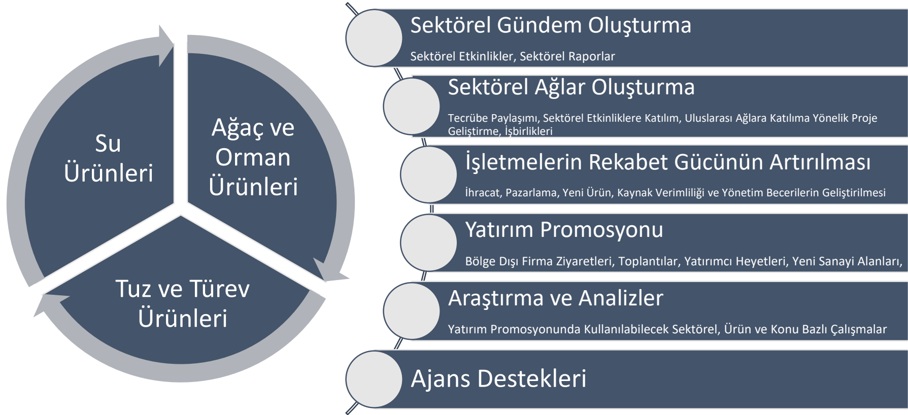
Şekil 3 Temel Sektörlerde Rekabetçiliğin Geliştirilmesi SOP Faaliyet Tipolojisi

Özel Amaç 3: Tuz ekosistemindeki unsurların katma değerinin artırılması ve tuzda ihtisaslaşmaya katkı sağlanması